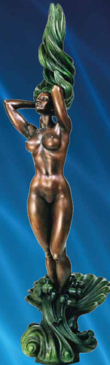
Авторская композиция «АФРОДИТА»