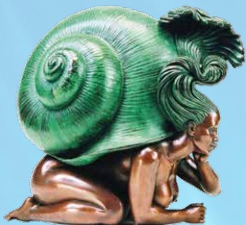
Авторская композиция «УЛИТКА №1»