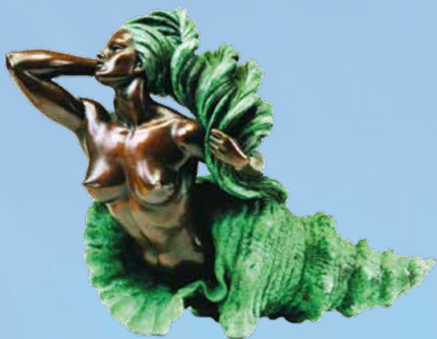
Авторская композиция «РУСАЛКА»