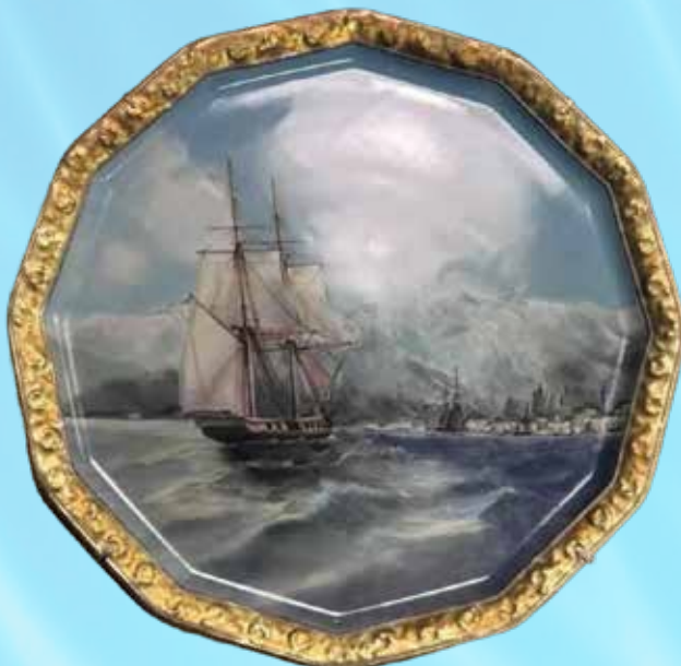
Панно по мотивам «КРЫМ» Айвазовский И.К. 1817-1900