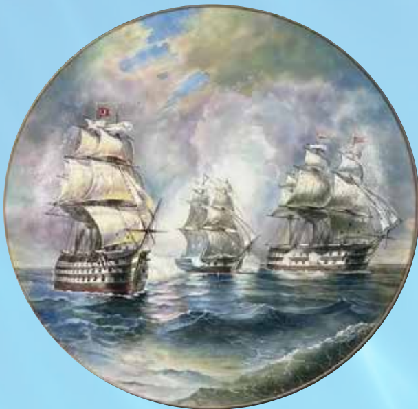
Панно по мотивам «БРИГ. МЕРКУРИЙ, АТАКОВАННЫЙ ДВУМЯ ТУРЕЦКИМИ КОРАБЛЯМИ»