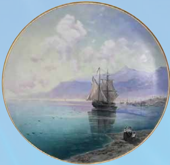
Панно по мотивам «ШТИЛЬ» Айвазовский И.К. 1817-1900

Ручная работа, авторская роспись по фарфору.