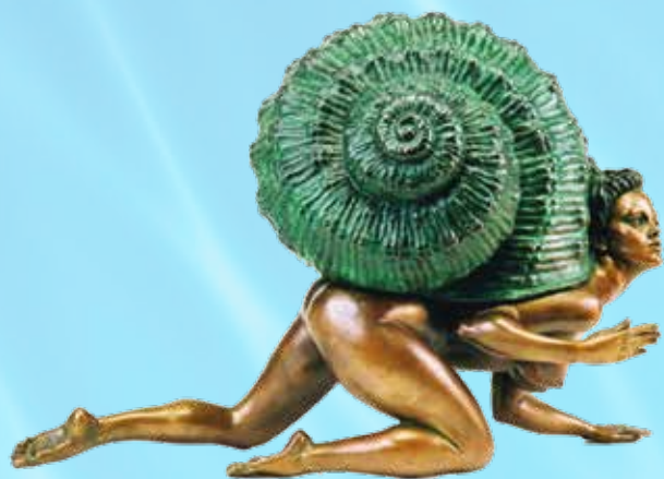
Авторская композиция «УЛИТКА №2»